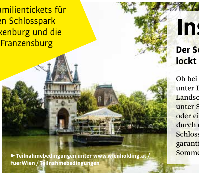
► Teilnahmebedingungen unter www.wienholding.at / fuerWien / Teilnahmebedingungen

Für Wien verlost drei Familientickets für den Schlosspark Laxenburg, inkl. Parkeintritt, Fähre und Führung auf der Franzensburg. Senden Sie ein E-Mail an zeitung@wienholding.at (Betreff: „Laxenburg“). Einsendeschluss 15. 8.