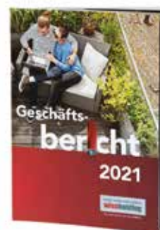
DER GESCHÄFTSBERICHT DER WIEN HOLDING 2021

Der weitere Konjunkturverlauf hängt neben zukünftigen COVID-19-Maßnahmen auch vom Krieg in der Ukraine ab. Dieser hat vielfältige ökonomische Auswirkungen und wird den Aufschwung im Euro-Raum und in Österreich etwas bremsen. Trotz der angespannten Situation liegt der Fokus des Wien Holding-Konzerns auf der Beibehaltung bzw. Steigerung von Investitionen in die Wiener Wirtschaft. ◆