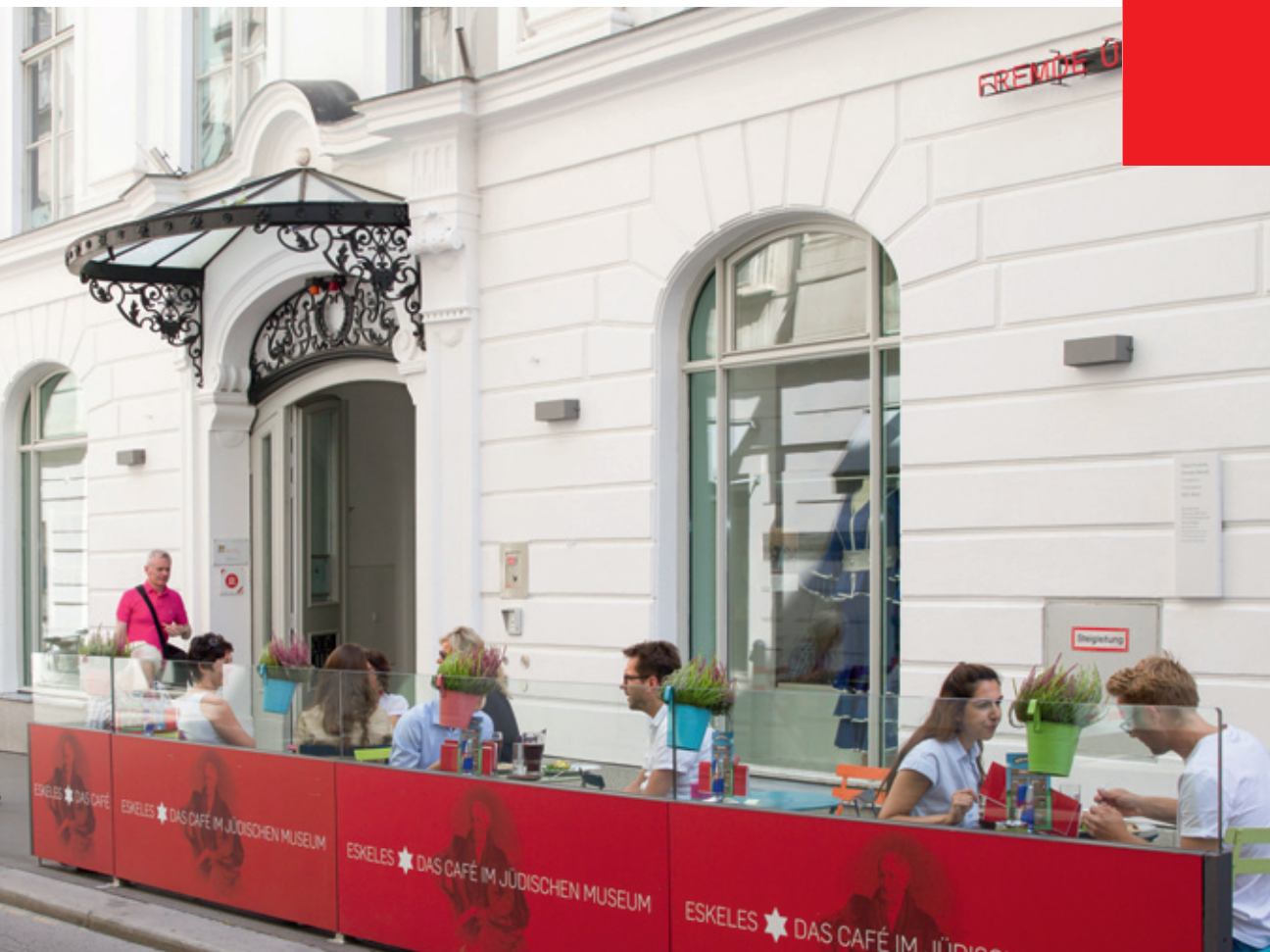
Jüdisches Museum Wien – Palais Eskeles